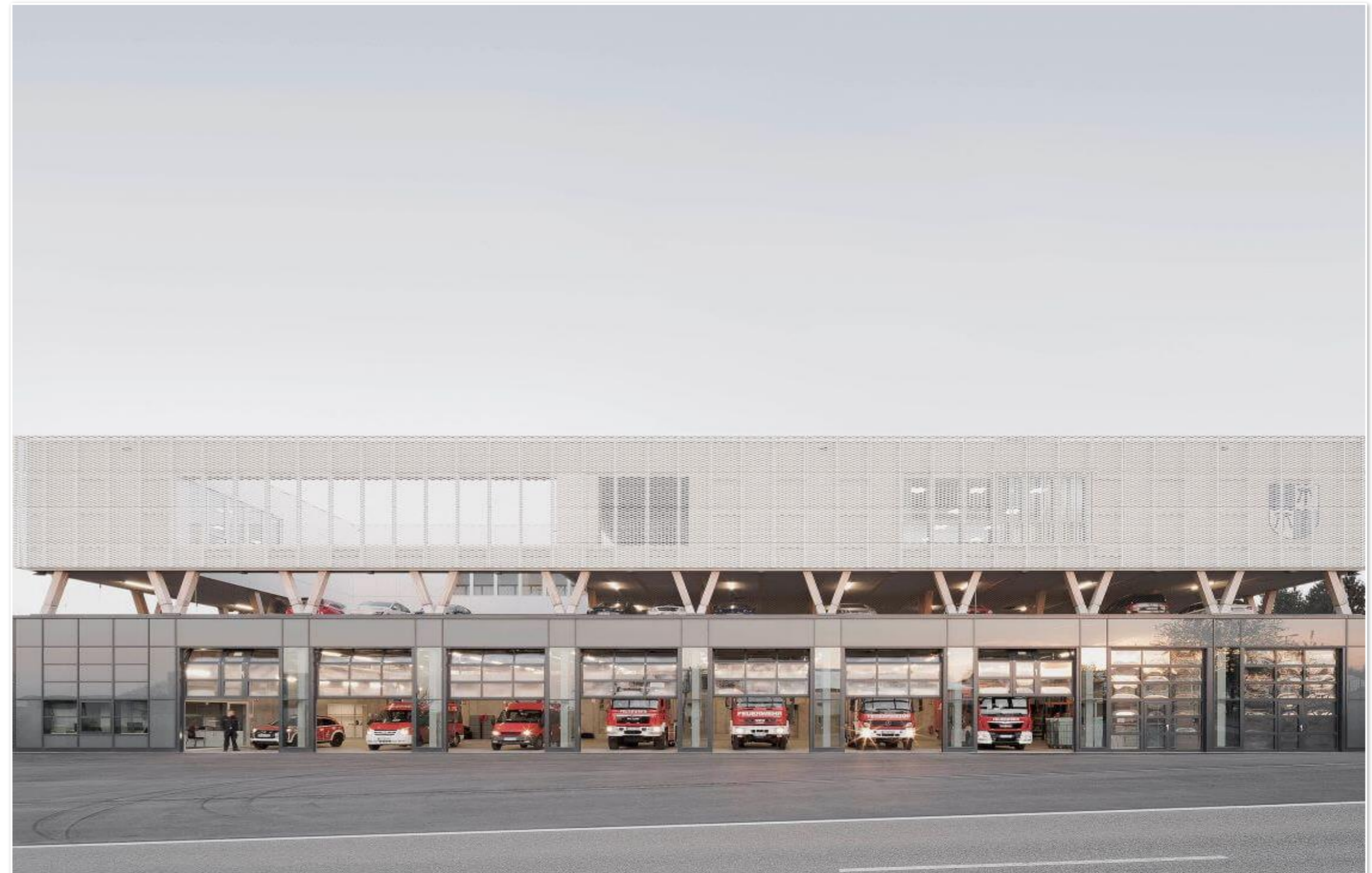
Zentrales Feuerwehrhaus Straubenhardt